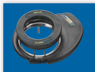
ELEKTRYCZNY NAPĘD STEROWANIA

Wspomagane sterowanie nigdy nie było łatwiejsze – po prostu zainstaluj przekładnię na kierownicę i antyrotacyjny zestaw mocujący na kolumnę kierownicy. W przeciwieństwie do innych systemów mechanicznych, nie ma potrzeby usuwania kierownicy, nie ma też kółka napędowego, często zahaczającego o palce. Solidna przekładnia napędowa cicho kręci kierownicą, a system wyczuwa kiedy chwytasz kierownicę i automatycznie się wyłącza. To oznacza, że szybciej można zakończyć instalację i korzystać z ułatwień wspomaganego sterowania.