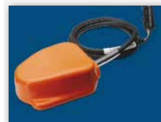
PRZEŁĄCZNIK PODŁOGOWY – W ZESTAWIE