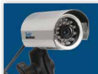
MOŻE OBSŁUŻYĆ DO OŚMIU KAMER